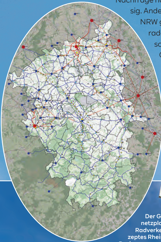
Der Gesamtnetzplan des Radverkehrskonzeptes Rheinisches Revier.