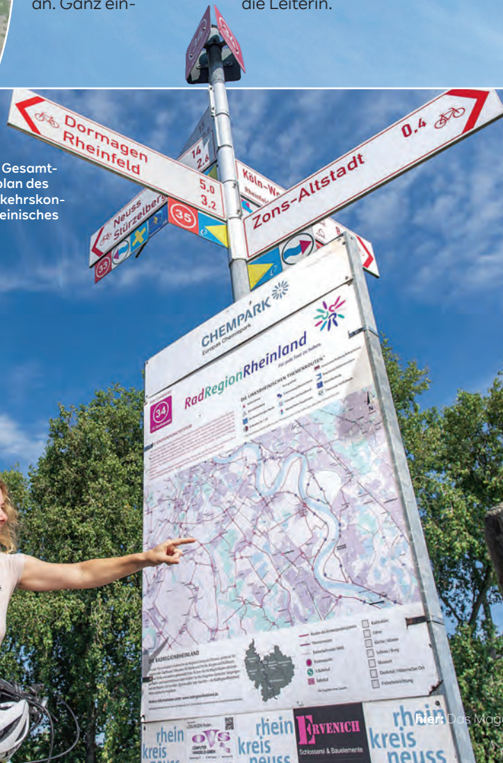
Radfahrer orientieren sich anhand einer Karte der Radregion Rheinland nahe Zons.