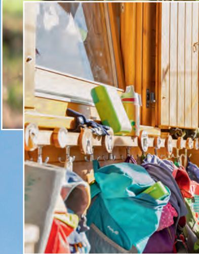
Da die Kinder die meiste Zeit des Tages drau- ßen verbringen, hängen auch ihre Rucksäcke griffbereit an der Außenseite der Hütte.

Besonders gefreut hat sie sich über eine Mutter, die anfangs noch nicht überzeugt war vom Konzept Wald-Kita, es aber trotzdem ausprobierte. „Irgendwann kam sie dann zu mir und sagte, es sei genau die richtige Entscheidung gewesen. Manchmal überzeugen die Kinder eben auch die Eltern.“