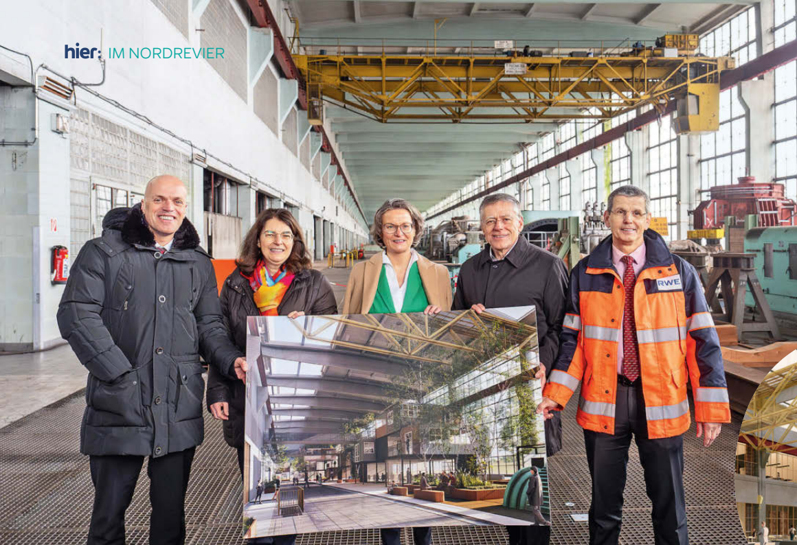
Maschinenhalle wird zur Denkfabrik: Die Vorfreude auf das neue Projekt groß.