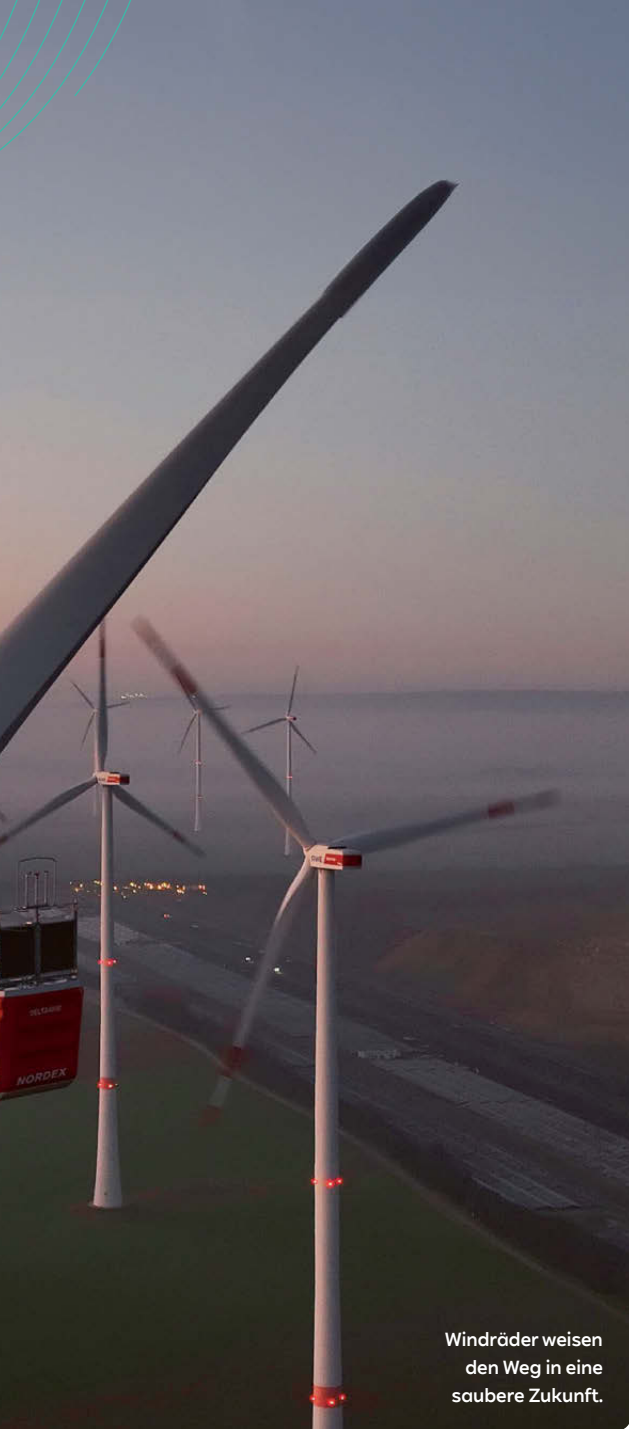
Windräder weisen den Weg in eine saubere Zukunft.

„Wir planen, weltweit 55 Milliarden Euro in Erneuerbare Energien, Speichertechnologien, flexible Erzeugung und Wasserstoffprojekte zu investieren.“