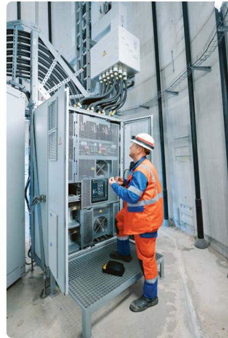
In den Anlagen versteckt sich jede Menge spannende Technik.

1.000 Megawatt sollen bis 2030 allein in NRW entstehen.