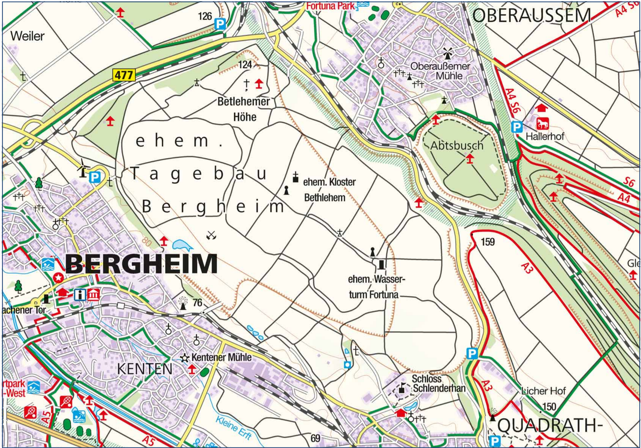
Kartografie: © KOMPASS-Karten GmbH