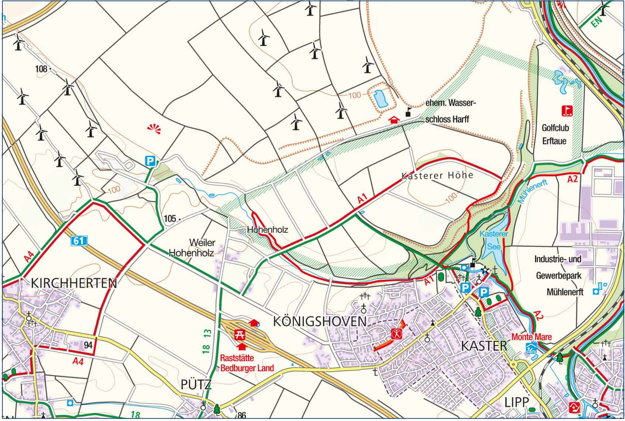
Kartografie: © KOMPASS-Karten GmbH