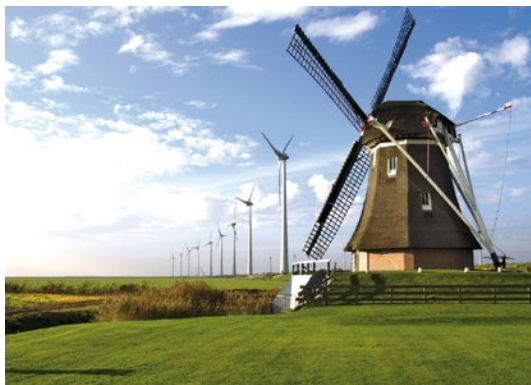
Onshore-Windpark Westereems, Niederlande

Innerhalb des RWE-Konzerns schaffen wir mit rund 1.300 Mitarbeitern eine eigene Kultur für erneuerbare Energien.