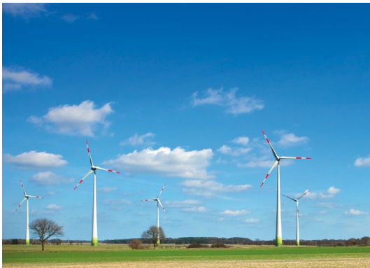
Onshore-Windpark Bartelsdorf, Deutschland

RWE betreibt seit über zehn Jahren Windparks in Europa. In Spanien und Großbritannien haben wir mit unseren bestehenden Onshore-Windparks bereits eine feste Basis. In weiteren Märkten wie Polen und Italien bauen wir unsere Kapazitäten weiter aus. In Deutschland und den Niederlanden konnte RWE Innogy ihr Portfolio durch die Übernahme der Windparks des niederländischen Energieversorgers Essent deutlich erweitern. In Deutschland gehört RWE Innogy mit rund 445 MW installierter Leistung zu den größten Windparkbetreibern unter den Energieversorgern.