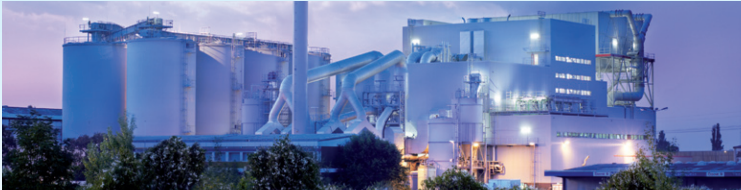
Das Biomasse-Heizkraftwerk Berlin-Neukölln versorgt die 20.000 Wohnungen der Gropiusstadt mit Wärme.