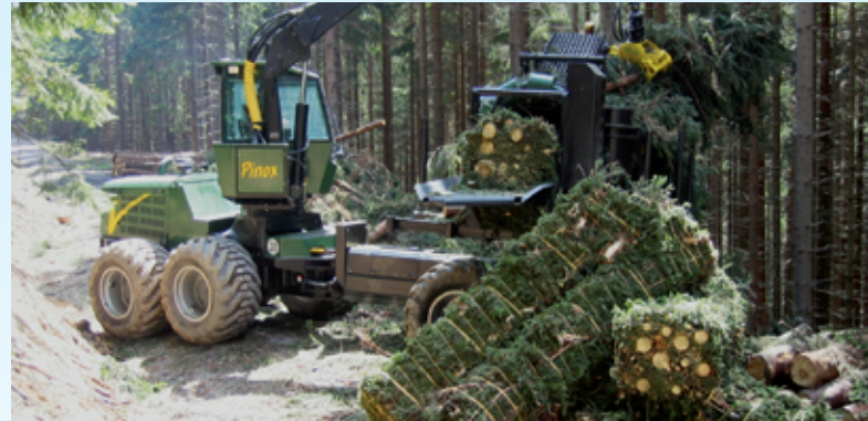
Waldrestholzgewinnung durch maschinelle Bündelung.

Beraten, entwickeln, planen, bauen, betreiben: Wir verfügen über alle erfolgsrelevanten Kompetenzen. Diese beinhalten im Einzelnen: