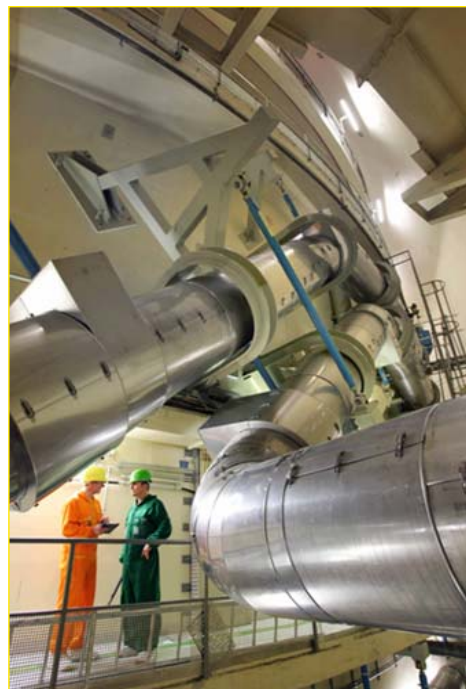
Frischdampfleitungen Block A nach der Ertüchtigung