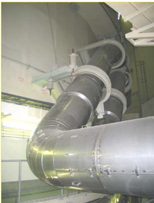
Frischdampfleitungen Block A vor Ertüchtigung

Die Blöcke in Biblis wurden so nachgerüstet, dass sie einem viel selteneren und stärkeren Erdbeben standhalten, als dem Beben, das zur Errichtungszeit der Auslegung zugrunde gelegt wurde. Um die bei einem derartigen Beben zu unterstellenden Schwingungen und Kräfte abzufangen, wurden im Rahmen des Nachrüstprogramms vor allem zahlreiche Behälterstützen, Aufhängungen und Verankerungen verstärkt oder ergänzt. Dem gingen aufwändige Datenerhebungen, Konstruktionsentwürfe und Computersimulationen voraus. Die Bauteile sind bei aller Standsicherheit so flexibel angebracht, dass sie extreme Schwingungen auch bei einem starken Erdbeben aushalten. Ein Beispiel für verstärkte Befestigungen sind die vier mit ihrer Isolierung jeweils meterdicken Frischdampfleitungen, die die Dampferzeuger im Reaktorgebäude mit der Turbine im Maschinenhaus verbinden. Sie wurden in neue Rohrhalterungen eingehängt und können jetzt selbst stärkste Schwingungen unversehrt überstehen.