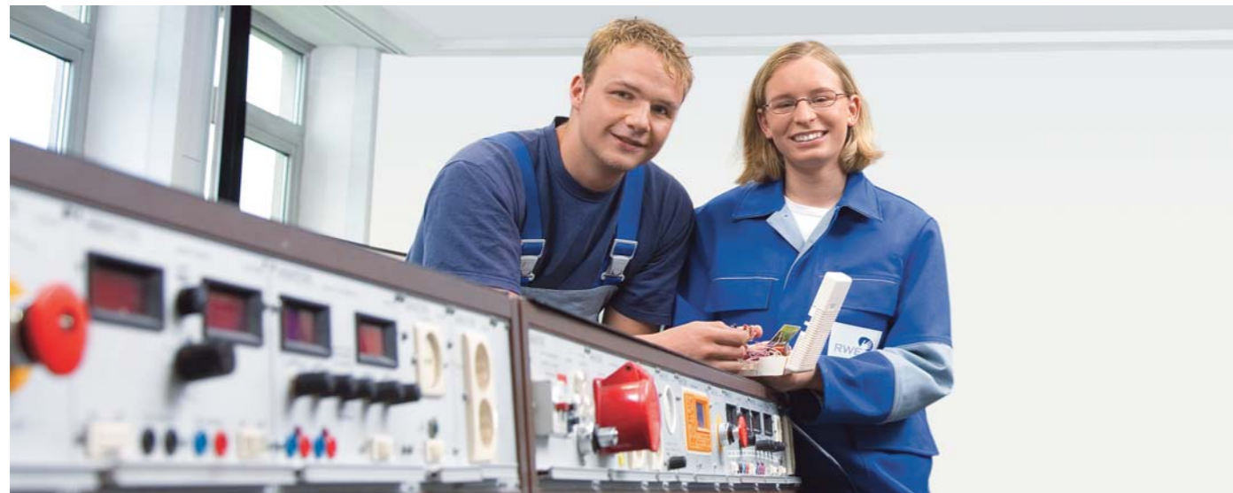
*Liquid Natural Gas

Mit der RWE npower gehört der führende Energieversorger Großbritanniens zu unserem Konzern. Er verfügt über ein integriertes Geschäftsmodell, das die Stromerzeugung aus Kohle, Gas, Öl und erneuerbarer Energien als auch den Vertrieb von Strom und Gas beinhaltet. Als interner Dienstleister unterstützt RWE Systems die Konzerngesellschaften und bietet Corporate Services in verschiedenen Sparten, etwa Konzerneinkauf/Kreditorenrechnung, Informationstechnologie und Managementberatung und Personaldienstleistungen.