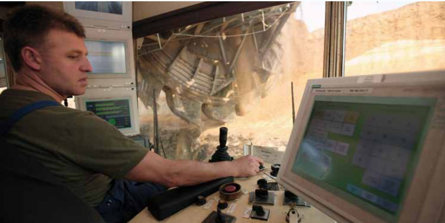
Der Großgeräteführer steuert Gewinnung und Fahrbewegungen des Baggers von einer Kanzel aus, die sich ganz vorn am Schaufelradausleger befindet.

Der Abraum wird über Förderbänder auf die ausgekohlte Seite des Tagebaus geleitet, die so genannte Innenkippe. Auf den einzelnen Arbeitsebenen, die hier Strossen heißen, verteilen Absetzer den Abraum und schichten das Erdreich terrassenförmig auf, bis das Loch verfüllt ist.