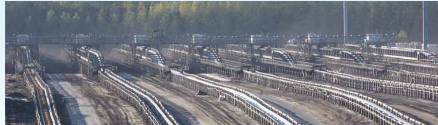
Bandsammelpunkt: Hier laufen die kilometerlangen Bandanlagen und damit die gewaltigen Massenströme zusammen.

Schaufelradbagger fördern sowohl Abraum als auch Kohle. Dies geschieht mit Schaufeln, die in ein Rad eingelassen sind wie die Zähne eines Zahnrades. Über eine schiefe Ebene rutscht das gebaggerte Material auf ein Förderband. Das Schaufelrad ist am Ende eines 70 Meter langen Fachwerkauslegers gelagert, der auch das Förderband für den Abtransport der Massen trägt. Der Schaufelradausleger ist ein Teil des schwenkbaren Oberbaus des Baggers und kann gehoben und gesenkt werden. Das besorgt die Hubwinde auf dem Gegengewichtsausleger. Seile übertragen die notwendigen Hubkräfte über zwei markante Pylone aus Stahlfachwerk. Der Ballast am Ende des Gegengewichtsauslegers gleicht das Gewicht des Schaufelradauslegers aus. So kann der