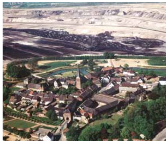
Alt-Kaster Mitte der 70er Jahre.

Das Abbaufeld Garzweiler wird nach dem Auslaufen der Gewinnung in 35 Jahren überwiegend landwirtschaftlich rekultiviert sein. Der östliche und nördliche Teil dieser waldarmen Bördenlandschaft, die seit jeher intensiv agrarisch genutzt wird, soll den Landwirten der Region als Wirtschaftsraum zurückgegeben werden. Das wertvollste Kapital zur Rekultivierung dieser Flächen liefert die Natur selbst: den äußerst fruchtbaren Lössboden, der ausreichend und in hoher Qualität zur Verfügung steht.