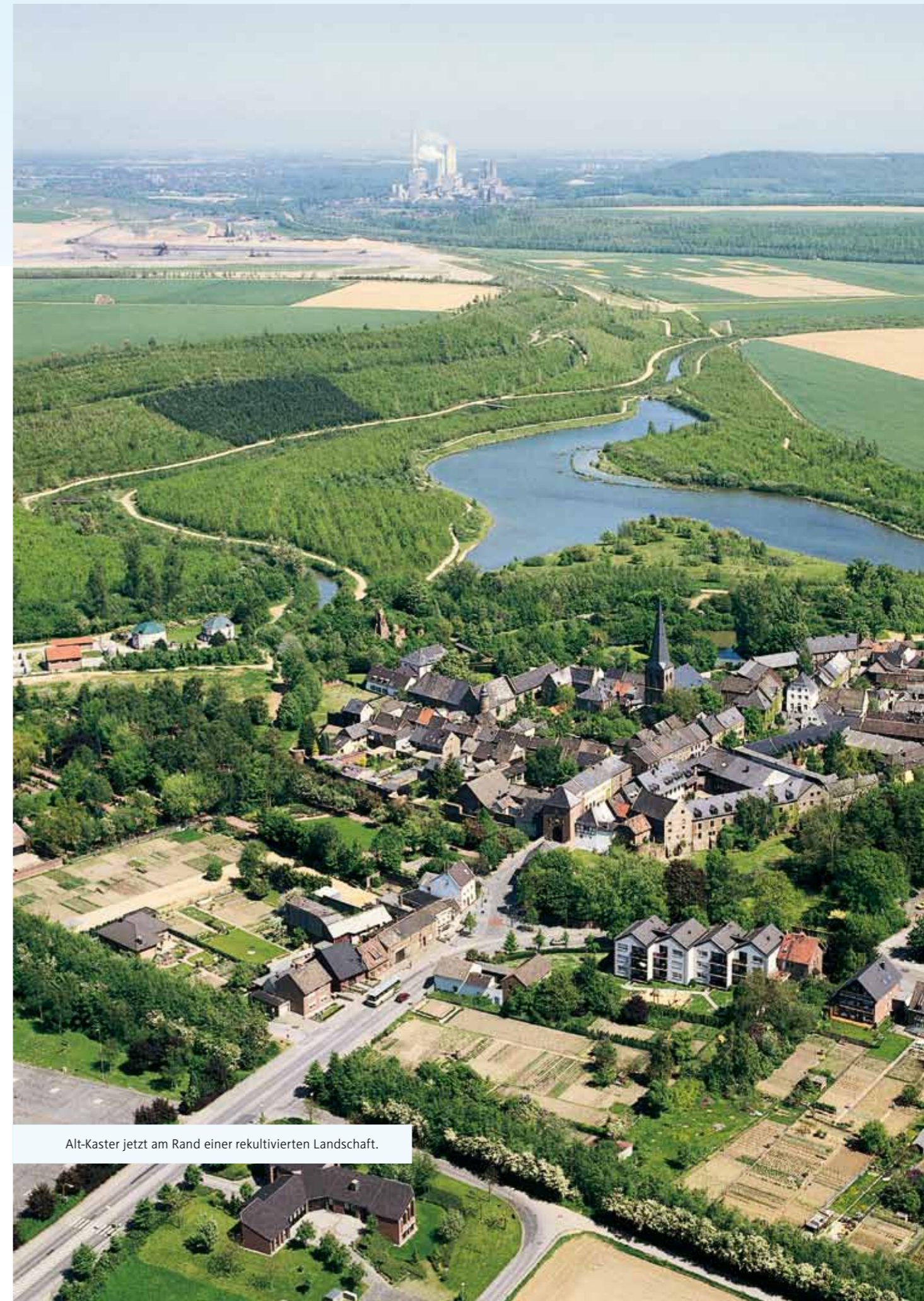
Alt-Kaster jetzt am Rand einer rekultivierten Landschaft.