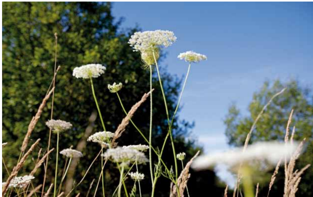
Rekultivierung: keine Kopie der früheren Landschaft, sondern viel Raum für Natur.

Bei all diesen Maßnahmen liegt es nicht in der Hand des Menschen, die Natur eins zu eins so wiederherzustellen, wie sie einmal war. Doch hat die Erfahrung gezeigt, dass bei ökologisch sachgemäßer und wissenschaftlich hochwertiger Starthilfe die Selbstheilungskräfte der Natur so hoch sind, dass sich die vom Bergbau in Anspruch genommene Landschaft in absehbarer Zeit in den übrigen Kulturraum eingliedert.