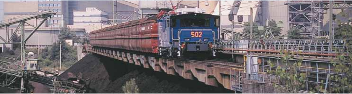
Kohlenzug der Werksbahn auf dem Kohlebunker des Kraftwerks Neurath.

Die Züge werden in den Tagebauen halbautomatisch beladen. Sie durchfahren eine Beladebrücke, auf der ein Förderband verläuft. Kohle, Abraum oder Löss werden durch Trichter von oben in die Waggons gefüllt. In diesem Bereich verlaufen die Fahrleitungen seitlich des Zuges. Da der Lokführer von der Spitze aus die Beladung nicht beobachten kann, wird sein Zug während des etwa 14 Minuten dauernden Vorgangs vom Beladewärter funkfern gesteuert. Die Fabrik-Anschlussbahnen transportieren jährlich etwa eine Million Tonnen Veredlungsprodukte in Wagen nach Bauart der Deutschen Bahn. RWE Power stellt sie zu Zügen zusammen und übergibt sie externen Eisenbahn-Verkehrsunternehmen, wie der Deutschen Bahn, dem Häfen- und Güterverkehr Köln oder der Neusser Eisenbahn zum Weitertransport zu den Kunden.