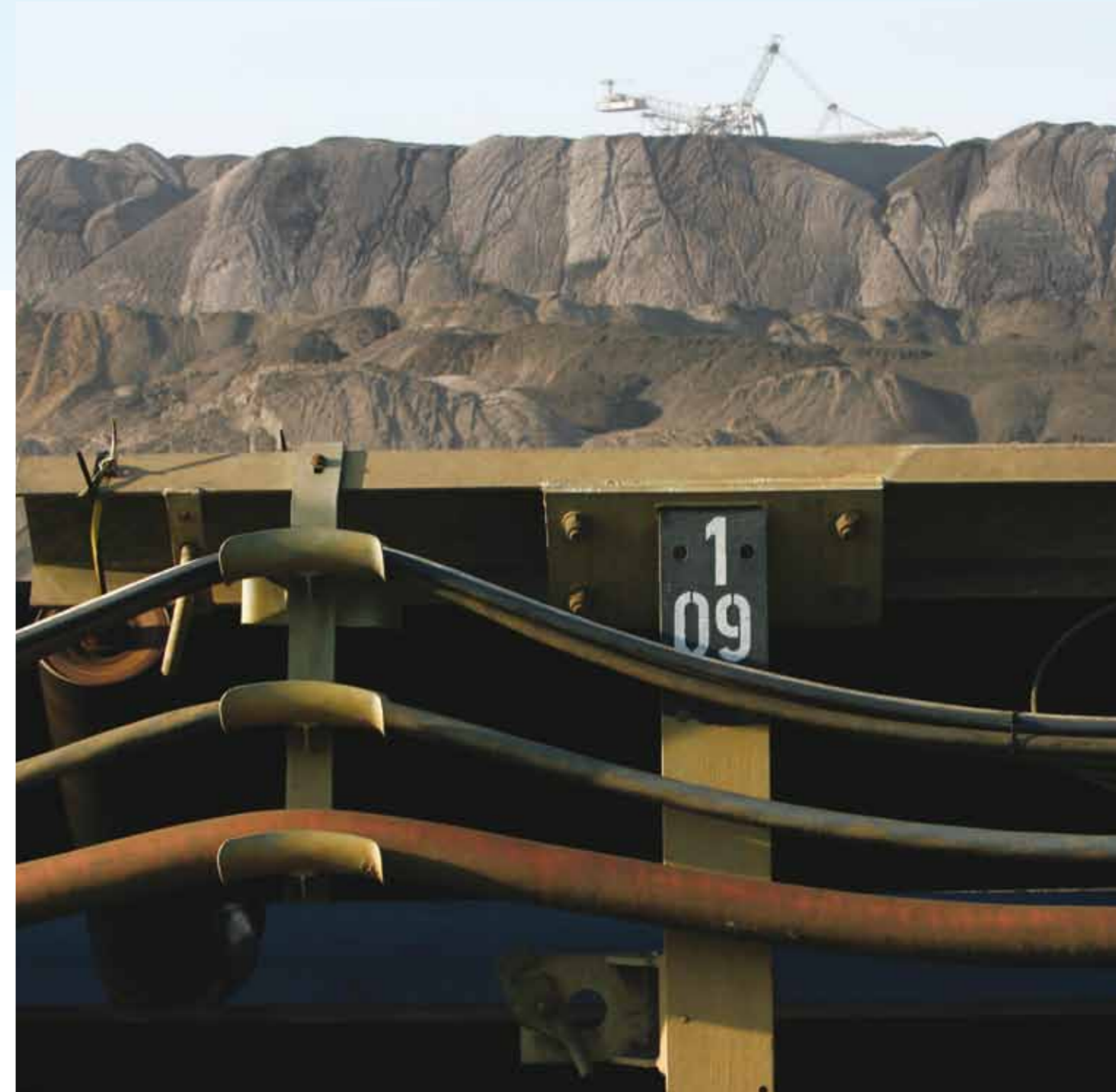
Lebensadern des Tagebaus: Die Bandanlagen bewältigen nicht nur die Massentransporte, sondern tragen auch Stromkabel und die Feuerlöschleitung.

Über kilometerlange Leitungen werden die Großgeräte und Bandanlagen mit elektrischer Energie versorgt. Allein ein Schaufelradbagger der 240.000er Klasse verbraucht täglich im Durchschnitt 200.000 Kilowattstunden – den Strom einer Kleinstadt mit 17.000 Einwohnern. Doch die Zahl täuscht: Der gesamte Tagebaubetrieb verbraucht nur 3,5 Prozent der elektrischen Energie, die er mit der Braunkohlegewinnung erwirtschaftet.