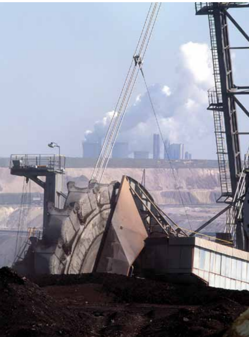
Die Braunkohle des Tagebaus Garzweiler wird zur Stromerzeugung in den nahegelegenen Kraftwerken eingesetzt.

Braunkohle ist preiswert und in unserem Land in großen Mengen verfügbar. Dazu kommt: Sie ist nicht auf Subventionen angewiesen. Braunkohle hilft damit auch auf lange Sicht, unsere Energieversorgung zu sichern.