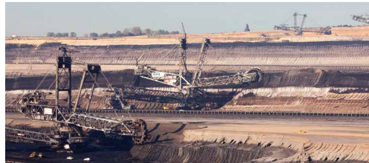
Gewinnungsseite: Auf jeder Sohle arbeitet ein Schaufelradbagger, um dort nacheinander Abraum und Kohle zu gewinnen.

Die Kohle wird überwiegend auf den unteren Sohlen gewonnen; die Bagger auf den darüber liegenden Sohlen tragen den Abraum, also die Deckschicht, ab. Förderbänder transportieren Kohle und Abraum zu einem Verteiler, dem Bandsammelpunkt. Dort werden die Massen auf unterschiedliche Transportwege geleitet: Die Kohle gelangt entweder zur Zwischenlagerung in den Kohlebunker am Rand des Tagebaus. Oder sie wird direkt zu den umliegenden Kraftwerken oder Veredlungsbetrieben transportiert. Das geschieht je nach Entfernung entweder mit Bandanlagen oder per Eisenbahn.