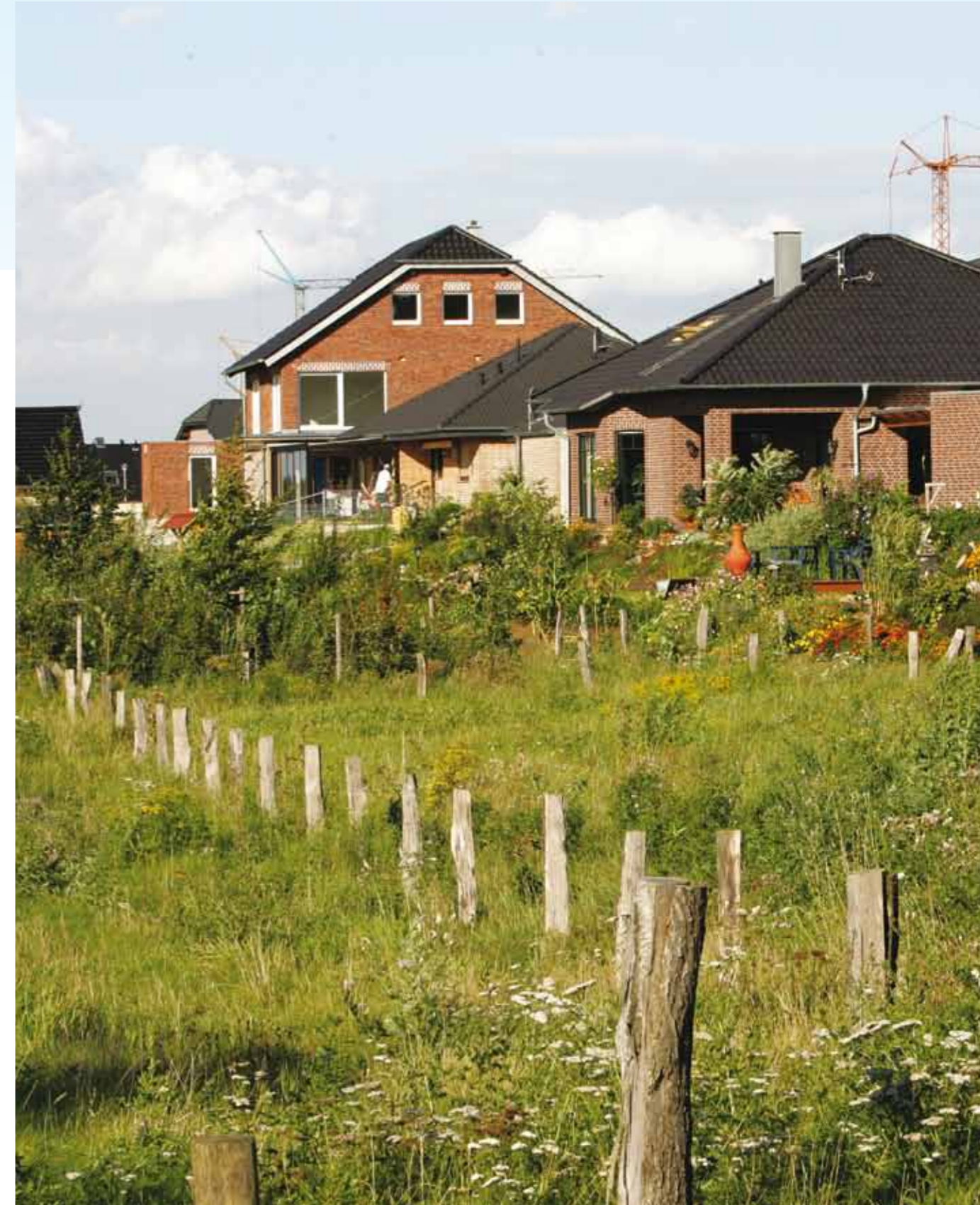
Umsiedlungsstandort Otzenrath/Spenrath in der Bauphase.

deten Neubeginn. Bei der Umsiedlung geht es vor allem um immaterielle Werte, wie Tradition, Gemeinschaft und Heimat, die mit Geld nicht entschädigt werden können. Belastungen für den Einzelnen, für die einzelne Familie sind unvermeidlich. Doch man kann sie durch eine weiterhin intakte Dorfgemeinschaft abfedern. Das Gefüge einer Dorfgemeinschaft besteht aus vielschichtigen Verflechtungen zwischen den einzelnen Umsiedlern, aus familiären Bindungen, aus Freundschaften, aus Nachbarschaften, aus Mitgliedschaften in Vereinen und Vereinigungen. Bei jeder Umsiedlung gilt es, Strukturen und Wandel dieses Beziehungsgeflechts zu erkennen und zu fördern, damit sich die Dorfgemeinschaft am neuen Standort etablieren und weiterentwickeln kann. Dazu verfolgen alle Beteiligten das Konzept der gemeinsamen Umsiedlung. Dabei siedeln möglichst viele Bewohner des alten Dorfes möglichst zügig mit in einen neuen, gemeinsam mit ihnen ausgewählten und geplanten Standort um – zum Beispiel aus Alt-Garzweiler nach Neu-Garzweiler. Das Konzept hat sich in Jahrzehnten bewährt.