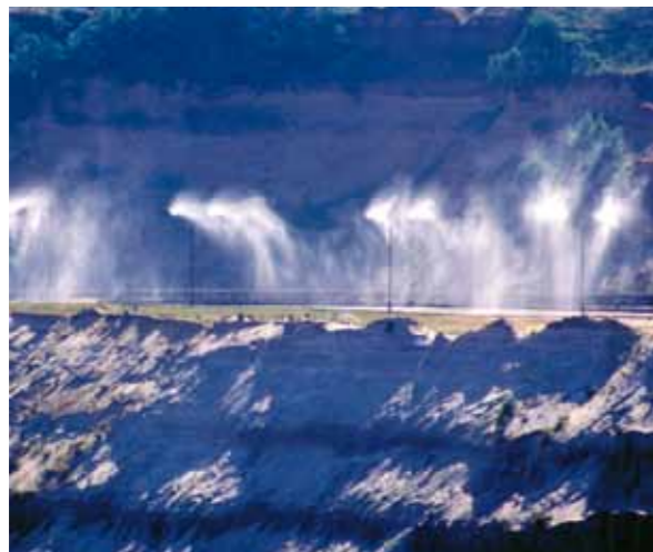
Sprühmasten im Tagebau.

Gezielte Maßnahmen mindern die Staub- und Lärmentwicklung aus dem Tagebau und minimieren damit die Belästigung der in Nachbarschaft zum Betrieb lebenden Menschen: Freigelegte Abraum- und Kohleflächen werden durch bewegliche Regnerautomaten feucht gehalten oder durch Einsaat von Gras, Raps oder Getreide befestigt. Düsen am Schaufelrad des Baggers und an den Bandübergabestellen versprühen ständig Wasser und verhindern, dass der bei Gewinnung und Transport von Kohle entstehende Staub aufwirbelt. Am Rande des Tagebaus sprühen rund 300 Beregnungsmasten feine Wasserschleier aus, die den Staub niederschlagen. Weitere stationäre Wenderegner übernehmen diese Aufgabe innerhalb des Tagebaus. Zur Lärmbekämpfung werden Antriebe von Baggern, Absetzern und Bandanlagen Geräusch dämmend gekapselt. Die Bandanlagen werden mit lärmarmen Rollen ausgerüstet. Darüber hinaus schützen Erdwälle am Tagebaurand nahe liegende Orte vor Lärm.