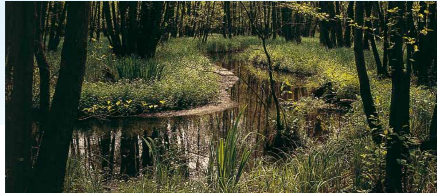
Mühlenbachaue im Naturpark Maas-Schwalm-Nette.