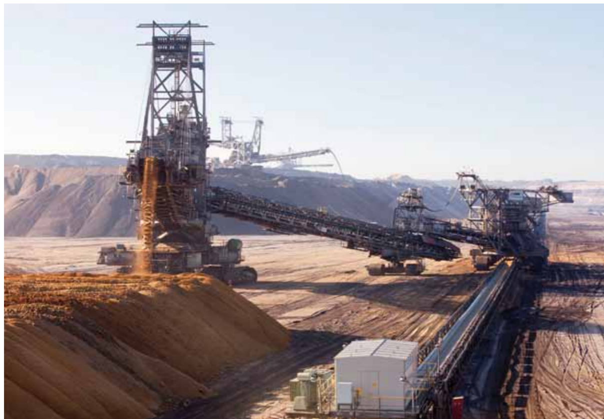
Verkippsseite: Hier verteilen Absetzer den Abraum, also Kies, Sand und Ton, und bereiten der späteren Rekultivierung den Boden.

Hauptstrecken sind die Nord-Süd-Bahn und die Hambachbahn, auch „Schlagadern des Reviers“ genannt. Das gut 32 Kilometer lange Doppelgleis der Nord-Süd-Bahn verbindet Frimmersdorf im Norden mit dem Hürth-Knapsacker Industriegebiet im Süden. Die Fahrt mit dem üblichen Tempo von 60 Kilometer pro Stunde dauert etwa eine Dreiviertelstunde. Ein 22 Kilometer langer, ebenfalls zweigleisiger Abzweig führt in etwa halbstündiger Fahrt zum Tagebau Hambach (Hambachbahn). Der Bahnbetrieb verfügt über 30 Elektrolokomotiven, 14 Diesellokomotiven und ca. 700 Waggons. Das Schienennetz erstreckt sich über 300 Kilometer. Jedes Jahr transportiert die Werksbahn rund 60 Millionen Tonnen Rohkohle.