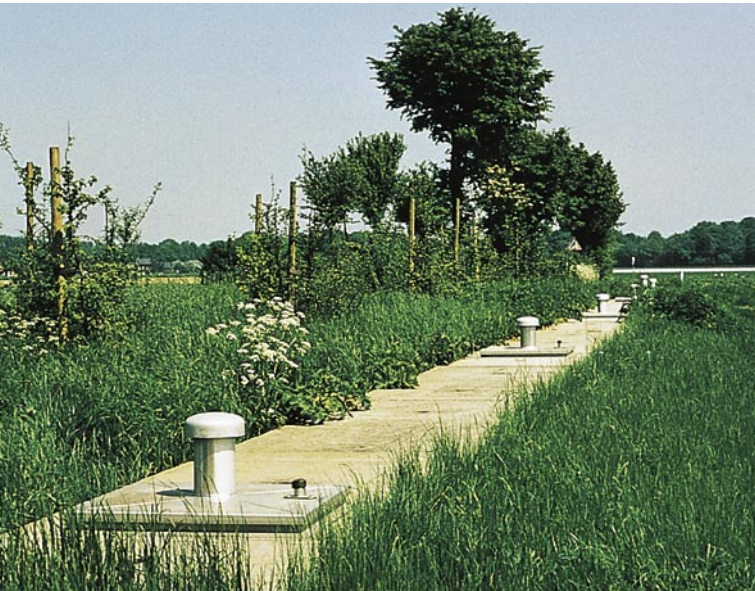
Sickerschlitze östlich von Wegberg

durch die Grundwasserabsenkung für den Tagebau Garzweiler I bereits vorgeschädigt waren, etwa im Bereich der Norf und entlang der Erft, in der Niersniederung südlich von Wickrath, am