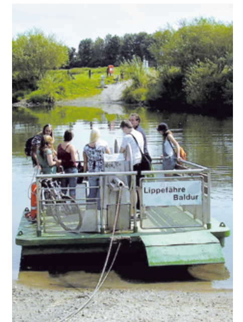
Gemütlich mit der Fähre über die Lippe.

Hier finden Sie weitere Informationen: www.route-industriekultur.de (Themenrouten 7 und 21)