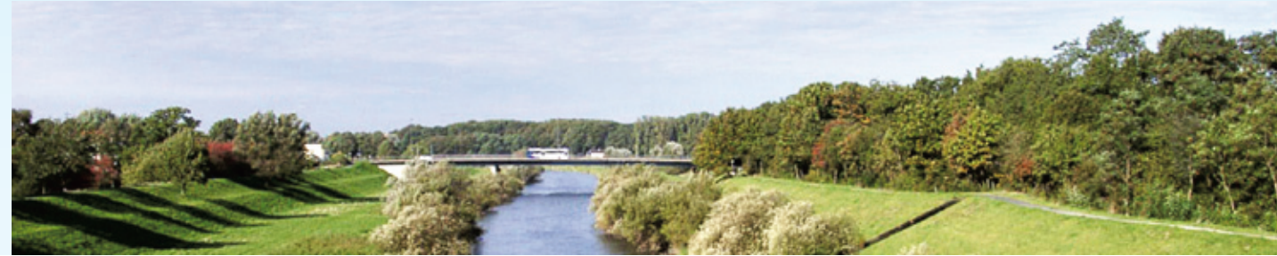
Idyllisch radeln durch die Lippeauen.

Über den historischen Kreskenhof und die Bauernschaft Emmelkamp geht es zum Hambach und schließlich zum Blauen See.