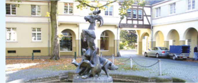
Denkmalgeschützt: die Zechensiedlung Hervest.

Die 400 Jahre alte Tüshaus Mühle ist ein technisches Kulturdenkmal – und ein wahres Multitalent. Sie wurde als Walk- und Ölmühle und auch zum Mahlen von Korn genutzt und lieferte zudem Energie für die Mühlengebäude. Besondere Naturerlebnisse bieten Wienbach und Hervester Bruch . Von einer Beobachtungsplattform sind Kiebitz, Schafstelze und Co. zu erspähen. Im Hervester Bruch grasen die Heckrinder, die mit ihren geschwungenen Hörnern den ausgestorbenen Auerochsen ähneln. Die denkmalgeschützte Zechensiedlung Hervest dokumentiert die lange Bergbau-Vergangenheit und den Wandel der Region.