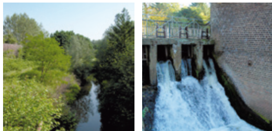
Es geht zum Hambach und zum Tüshaus Wehr.

Imposante Deiche und malerische Auenlandschaften erwarten Radwanderer bei den zwei Touren, die Lippeverband und Stadtmarketing Dorsten entwickelt haben und die an der Hohenkampbrücke im Stadtteil Holsterhausen starten. An der kürzeren Runde zu Hambach und Lippe erzählen unterwegs elf Infostationen des Lippeverbandes interessante Geschichten rund ums Wasser. Dabei fahren die Radler mit dem E-Bike entspannt und lautlos zwischen Lippe und Kanal entlang, setzen gemütlich mit der Fähre über den Fluss, passieren das Pumpwerk Hambach und genießen die Tier- und Pflanzenwelt der Lippeaue.