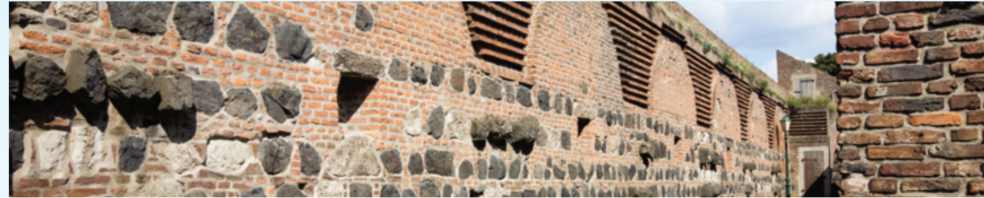
Mittelalterlich: die Festungsmauer im Dormagener Stadtteil Zons.

Dank des E-Bike-Motors geht es aber gut voran. Die Route führt über Düren und das beschauliche Vettweiß nach Erftstadt, dabei prägen nun Flussauen, Wiesen und Felder das Landschaftsbild. Bei Bergheim am Schloss Paffendorf beginnt die „Straße der Energie“: eine spannende Themenroute durch die rheinische Braunkohleindustrie, die der Rhein-Erft-Kreis und RWE entwickelt haben. Die Route erreicht schließlich über Grevenbroich das Ziel dieser Etappe: die Stadt Dormagen, wo Radler mit Blick auf den Rhein entspannt die Füße hochlegen können. www.kaiser-route.info