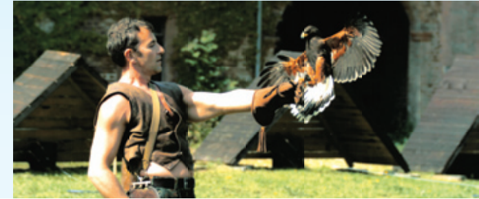
In Erftstadt sind Greifvögel in Aktion.

Der Aachener Dom gehört zum Unesco-Weltkulturerbe und ist vor allem für sein karolingisches Oktogon berühmt. Er ist Krönungskirche deutscher Könige und beherbergt das Grab Karls des Großen. Der Papierherstellung gestern und heute widmet sich das Papiermuseum Düren . Bei Workshops entstehen kleine Kunstwerke aus selbst geschöpftem Papier. Bei den Flugshows der Falknerei am Schloss Gymnich in Erftstadt sind majestätische Greifvögel in Aktion zu erleben.