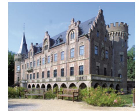
Schloss Paffendorf mit dem RWE-Infozentrum.

Hier finden Sie weitere Informationen www.leopoldhoeschmuseum.de www.aachendom.de www.falknerei-schloss-gymnich.de www.paffendorf-erft.de www.dormagen.de