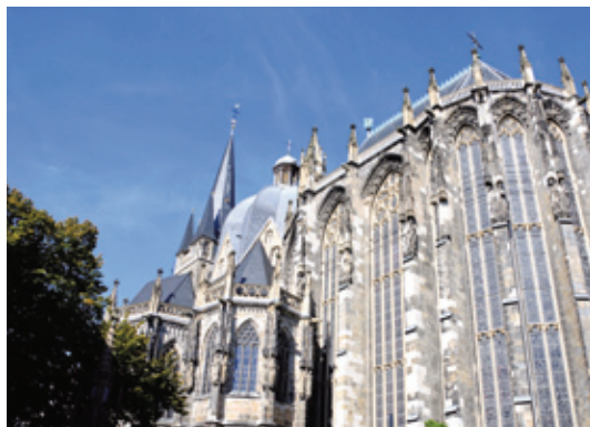
Der Aachener Dom gehört zum Weltkulturerbe.

Zwischen Aachen und Dormagen steht die sportliche Reise ganz im Zeichen Karls. Wo er mit seinem Heer schon im Jahr 775 gegen Sachsen zog, erfreuen sich heute Radler an Landschaft und Sehenswürdigkeiten. Der Startschuss zur Tour fällt natürlich in der Kaiserstadt Aachen, die auch für ihre leckeren Printen bekannt ist. Eine Stärkung vor der Abfahrt ist nicht verkehrt, denn gleich der erste Abschnitt wartet mit einigen stärkeren Steigungen auf.