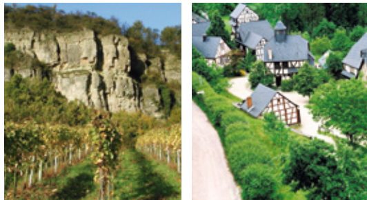
Die Kalkfelsen bei Nittel und der Roscheider Hof in Konz.

Beim Radfahren an diesen Flüssen gehen Bewegung und Genuss eine ganz besondere Verbindung ein. Denn der Wein prägt diese Region in jeder Hinsicht: Während das Auge sich an den grünen Hängen erfreut, an denen die Trauben reifen, wird der Gaumen beim Einkehren mit manch gutem Tropfen verwöhnt. Die Tour beginnt in der Römerstadt Trier und lässt Radler auf den ersten Kilometern flott und mühelos an der Mosel entlang vorankommen. Schnell ist der Ort Konz erreicht. Hier mündet die Saar in die Mosel und die Route wechselt den Fluss: Südwärts geht es auf dem Saar-Radweg weiter, über Kanzem und Wiltingen bis nach Saarburg.