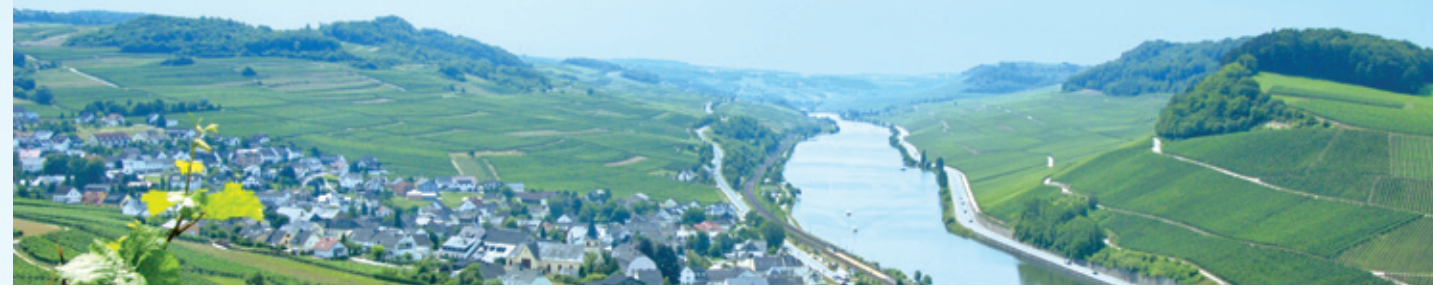
Bei Nittel genießen Radler den Blick über das Obermoseltal.

Schier endlose Weinberge und feine Tropfen: Zwischen Trier und Nittel spielen Landschaft und Geschmack die Hauptrolle.