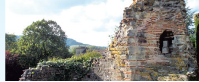
Von der Kaiservilla in Konz zeugen Ruinen.

In Trier , der ältesten Stadt Deutschlands, künden der mächtige Dom und die Porta Nigra mit ihren riesigen Sandstein-Quadern von der Baukunst der alten Römer. Diese und andere Römerbauten gehören zum Unesco-Weltkulturerbe. Ruinen zeugen von der spätromischen Kaiservilla in Konz , und das Freilicht-museum Roscheider Hof erzählt vom Leben in vergangenen Zeiten. Das romantische Saarburg lädt zur Rast am tosenden Leuk-Wasserfall mit seinem alten Kraftwerk ein: Mitten in der Stadt