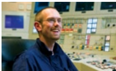
Обучение производственным навыкам