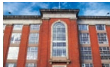
Технический учебный центр RWE, Великобритания

RWE гордится качеством своей программы повышения квалификации, целью которой является 3 уровень NVQ и государственный сертификат высшего образования по инженерному предмету. Качество программы признано другими компаниями, так как некоторые из них постоянно включают своих учеников в схему RWE.