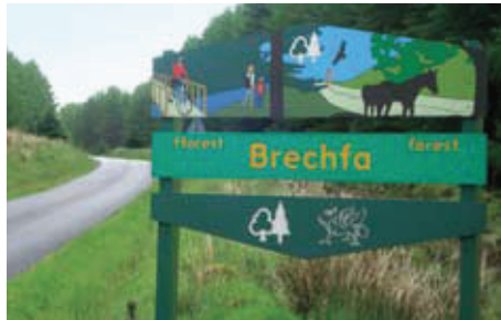
Yn ystod yr arddangosfeydd, hoffem esbonio sut y bydd ein cynnig yn mynd law yn llaw â'r goedwig

Yn ystod yr arddangosfeydd hyn bydd cyfle i gael gwybod mwy am brosiectau'r ffermydd gwynt arfaethedig ar eu ffurf ddrafft gyfredol. Yn dilyn yr arddangosfeydd, caiff unrhyw gynydd a wneir ei rannu drwy gylchlythyrau a