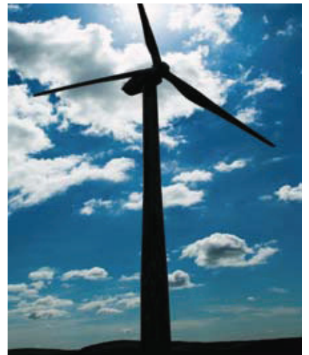
Bydd y Comisiwn Cynllunio Seilwaith yn penderfynu ar "Brosiectau Seilwaith Cenedlaethol Bwysig", gan gynnwys ffermydd gwynt mawr

Mae'r Comisiwn Cynllunio Seilwaith yn ymdrin â'r fath geisiadau ar sail genedlaethol, ond mae barn leol yn parhau i fod yn bwysig iawn i'r cynigion hyn. Yn ogystal â'r cylch cyfredol o rannu gwybodaeth â'r cyhoedd, bydd RWE npower renewables yn cynnal ymgynghoriad pellach ar ein cynlluniau manwl pan fydd yr holl wybodaeth am y prosiect ar gael a chyn cyflwyno ein cais i'r Comisiwn Cynllunio Seilwaith.