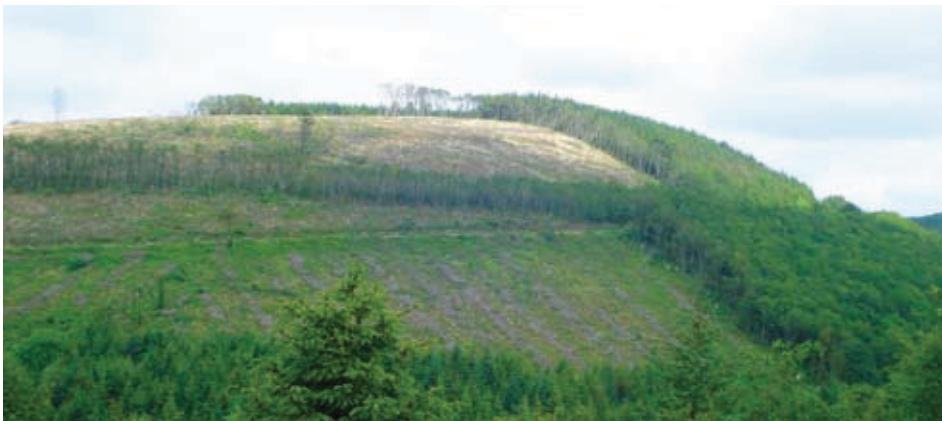
Gall ardaloedd o dir a gliriwyd eisoes fod yn lleoliadau da ar gyfer tyrbinau, a gall hyn lleihau'r effaith ar y goedwig

Penderfynir ar y cynlluniau ar gyfer y safleoedd yn dilyn trafodaethau gyda Chomisiwn Coedwigaeth Cymru ar sut i leihau effaith y ffermydd gwynt ar y goedwig. Gellir cyflawni hyn drwy, er enghraifft, leoli'r tyrbinau mewn mannau agored sy'n bodoli eisoes neu ardaloedd lle y torrwyd coed i lawr yn ddiweddar pan yn bosibl, a thrwy wneud y defnydd mwyaf o'r traciau sy'n bodoli eisoes.