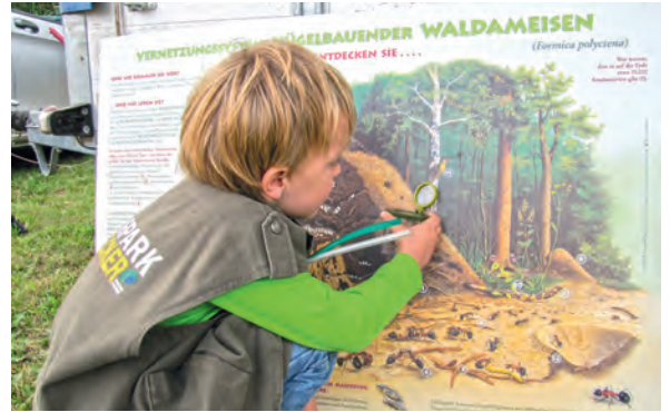
↑ KLEINE ENTDECKER lernen an den Stationen viel über die Natur.

Sophienhöhe. Ab dem 8. Juli wird es für Kinder und Jugendliche ein neues Angebot von RWE geben: einen Naturerlebnispfad. Nach einer Einführung im Klassenzimmer rund um das Thema Rekultivierung, geht es gemeinsam zur Sophienhöhe. Die Wanderung wird vom Haselmausmaskottchen Sophie begleitet. Vor Ort können die Schüler verschiedene Stationen zum Thema Rekultivierung entdecken, zum Beispiel einen begehbaren Haselmauskasten oder ein Waldbandolino mit Bäumen, Baumarten und anderen Waldbewohnern.