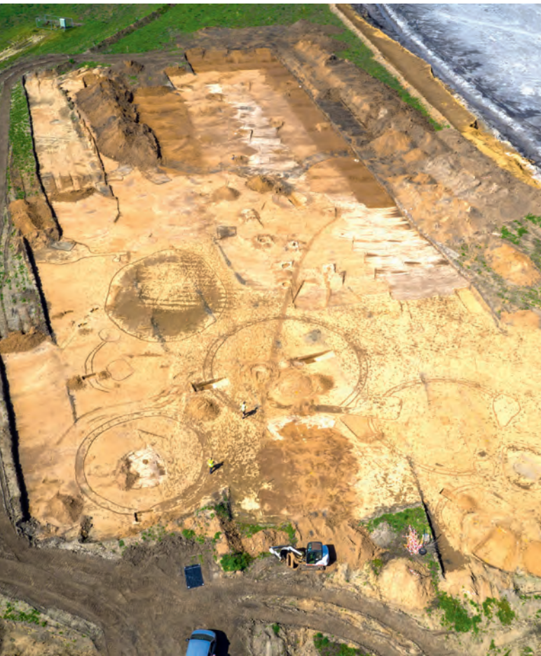
↑ VOGELPERSPEKTIVE: Aus der Luft lassen sich historische Siedlungen und einzelne Bauten im Tagebau Inden gut erkennen.