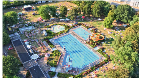
↑ FEUCHT-FRÖHLICH: Das Freibad Elsdorf bildet den passenden Rahmen für den Tag der Regionen.

Elsdorf. „Wir wachsen zusammen“ – das ist das Motto des Tags der Regionen, der am 8. September Menschen aus der Region in Elsdorf zusammenbringen möchte. Und weil eine große gemeinsame Feier schöner ist, verbinden die Stadt und RWE Power ihre Veranstaltungen: „Rock around the Pool“ trifft auf „40 Jahre Tagebau Hambach“ und „60 Jahre Bohrwesen und Wasserwirtschaft“.