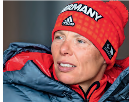
↑ TREFFSICHER: Puls runter und konzentrieren – Andrea Eskau bei den Paralympics in Pyeongchang.