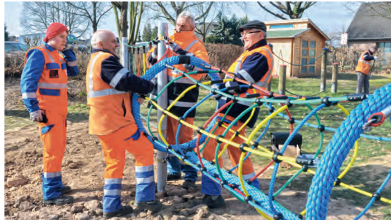
↑ VOLLER EINSATZ: RWE-Mitarbeiter aus dem Tagebau Hambach gestalteten eine kreative Spiel Landschaft.