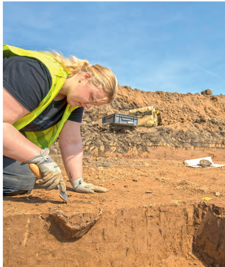
↑ NADEL im Heuhaufen: Die Archäologen suchen akribisch komplette Siedlungsräume ab.