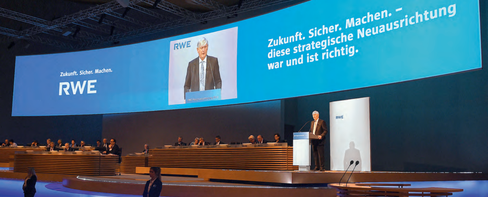
↑ HAUPTVERSAMMLUNG: Die Aktionäre unterstützen die Strategie von Vorstandschef Rolf Martin Schmitz.