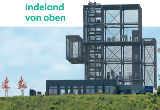
Der Indemann bietet einen herrlichen Blick über das Rheinische Revier und darüber hinaus.

Der Indemann mit seinen zahlreichen Plattformen bietet atemberaubende Aussichten auf den aktiven Tagebau und die Inde-Landschaft. An der Goltsteinkuppe entlang geht es weiter zur Audioinstallation „Zeichenkreis“, die in eine fremde Klangwelt aus dem Tagebau führt. Als Nächstes führt die Route am Aussichtspunkt des Tagebaus Inden, der Lamersdorfer Kirche und der katholischen Kirche Inden/Altdorf vorbei. Rund um den Lucherberger See geht es zurück zum Ausgangspunkt.