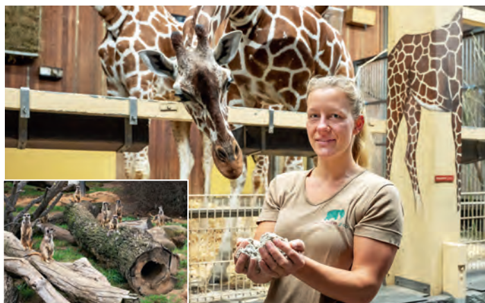
Sand aus dem Tagebau Garzweiler ist besonders schonend für die Hufen der Giraffen des Kölner Zoos.

Köln/Garzweiler. Es ist fast schon Tradition: Seit einigen Jahren unterstützt der Tagebau Garzweiler den Kölner Zoo durch Belieferungen mit tagebautypischem Material. Dank RWE dürfen sich die Tiere über Sand, Steine, Findlinge und Faserholz aus dem Tagebau freuen.