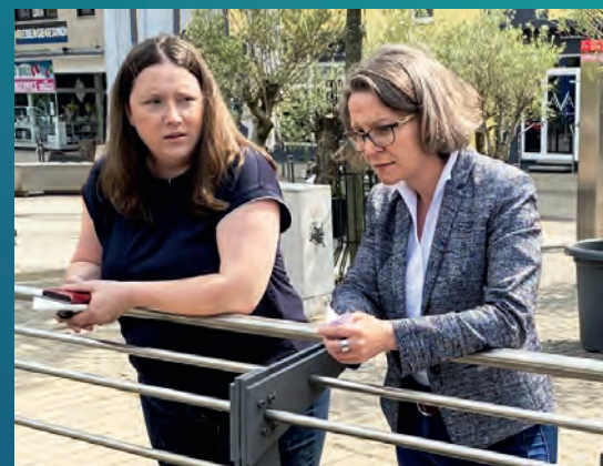
Eschweilers Bürgermeisterin Nadine Leonhardt (links) im Gespräch mit Ministerin Ina Scharrenbach