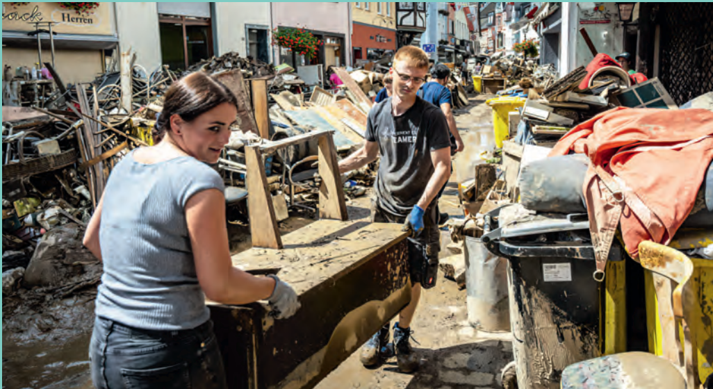
Zahlreiche Helfer packten in der Region mit an, räumten Häuser und Straßen auf.