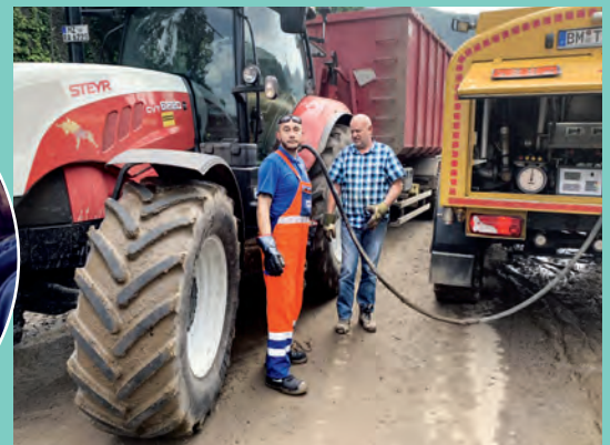
Tankfahrzeuge versorgten die mit großem Maschinenpark helfenden Landwirte und Bauunternehmen mit dringend benötigtem Diesel.