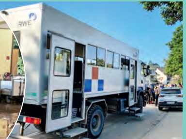
Mit Shuttle-Bussen wurden die Helfer ins Hochwassergebiet gebracht.