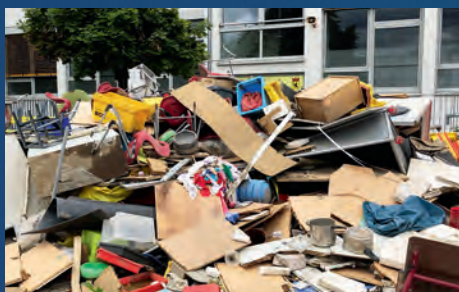
Die gesamte Inneneinrichtung einer Schule in Eschweiler wurde vom Hochwasser zerstört.

Nadine Leonhardt: Die Stadt und die Menschen sind schwer getroffen worden von der Flut. So einen Schlag schüttelt man nicht so einfach ab. Viele Menschen sind noch immer dabei, die Schäden zu beseitigen, aufzuräumen und zu entrümpeln. Nach dem Schock hatten viele aber auch erste ruhige Momente. Es herrscht weiterhin große Solidarität und Aufbruchsstimmung – eine Mischung aus Innehalten und Zuversicht trifft es ganz gut.