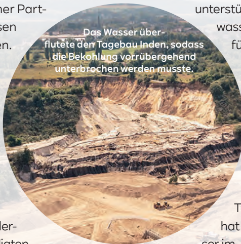
Das Wasser überflutete den Tagebau Inden, sodass die Bekohlung vorübergehend unterbrochen werden musste.