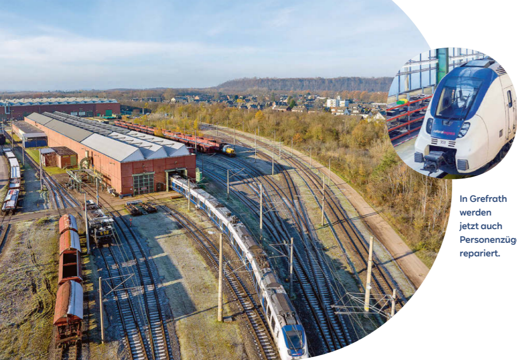
In Grefrath werden jetzt auch Personenzüge repariert.