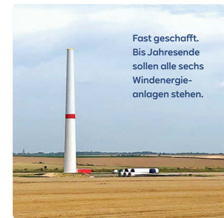
Fast geschafft. Bis Jahresende sollen alle sechs Windenergieanlagen stehen.

türme. Heißt: Jeder Turm besteht aus zwei Teilen; einem Betonturm und einem Stahlturm. Ziel ist, dass in den kommenden Wochen alle Betontürme stehen, dann folgen die Stahlsegmente. Zuletzt werden die Hauptkomponenten wie Maschinenhaus und Rotorblätter montiert. Im Windpark werden übrigens große Teile der alten Windenergieanlagen wiederverwendet – das schont die Ressourcen. —