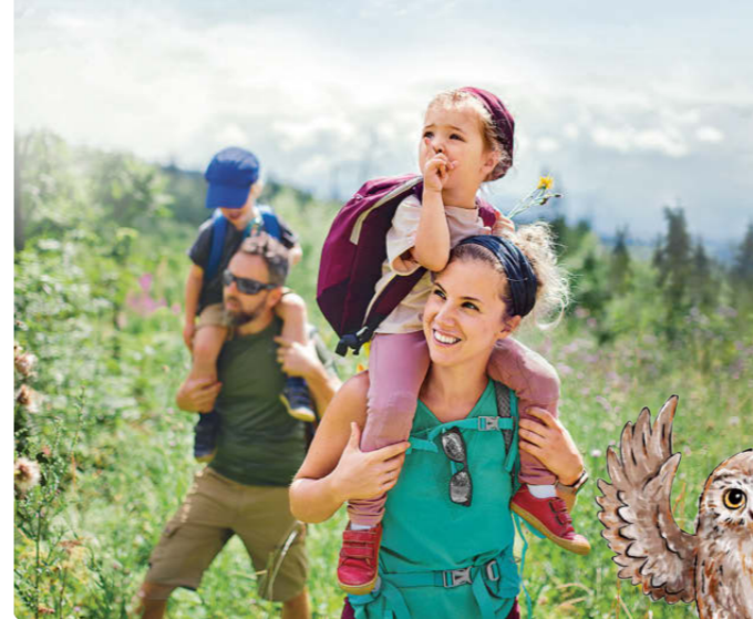
Das Elsachtal ist zu einem wanderbaren Feld-Wald-Naherholungsgebiet geworden.