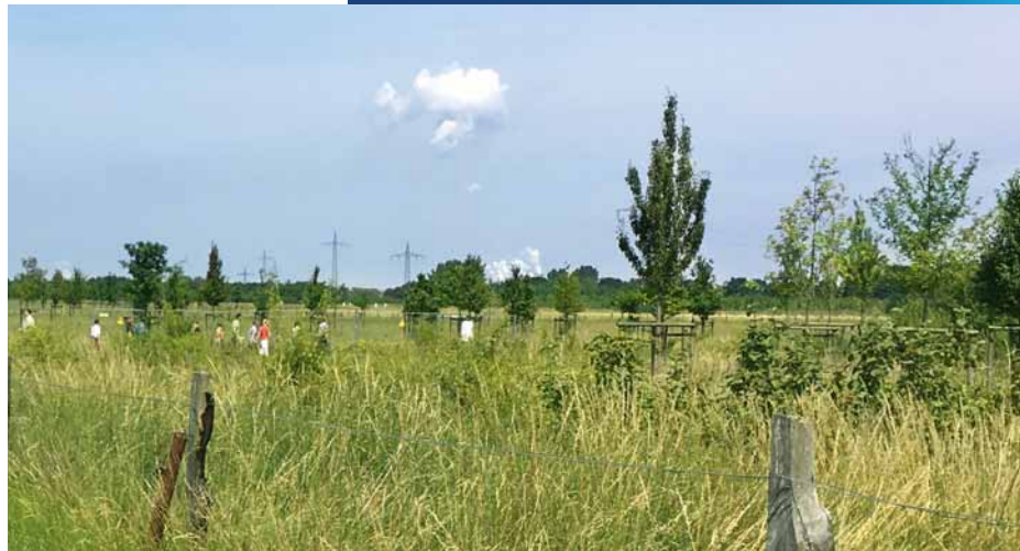
Halboffene parkartige Landschaft