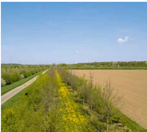
Blick auf eine Vernetzungsstruktur