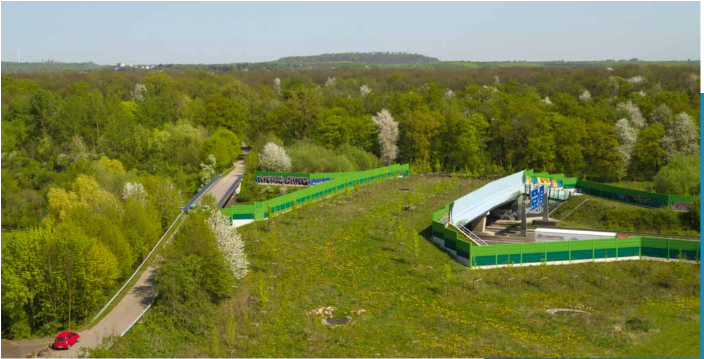
Grünbrücke über der A61 bei Kerpen