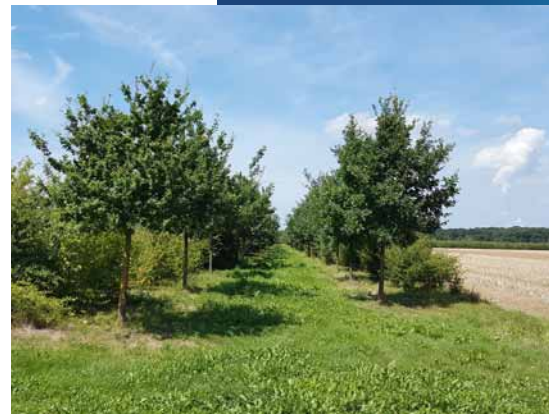
Blick auf eine Vernetzungsstruktur

Entlang von Wegen oder Gewässern werden zwischen den Altwaldgebieten im Umfeld des Tagebaus auf rund 40 km Länge mehrreihige Baum- und Strauchstrukturen in unterschiedlichen Breiten gepflanzt. Sie dienen der Vernetzung der Altwälder und entlang dieser Strukturen orientieren sich die Fledermäuse, um die neuen Lebensräume zu erkunden.