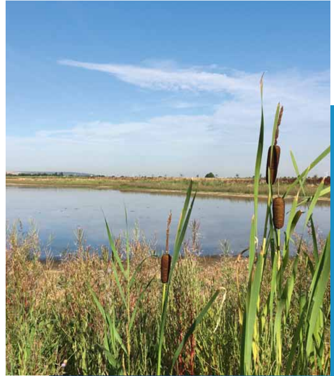
Neuer Lebensraum für Wasser-/Watvögel und Amphibien