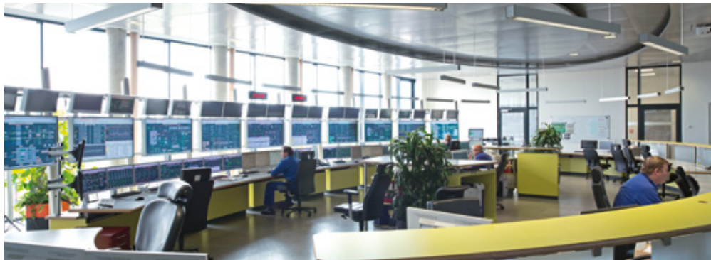
In der Leitstelle werden die Kraftwerksabläufe gesteuert.